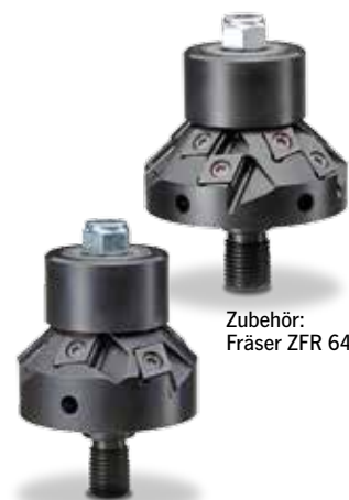
Zubehör: Fräser ZFR 645