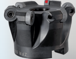
Zubehör Aufsteckfräser ZFR 500