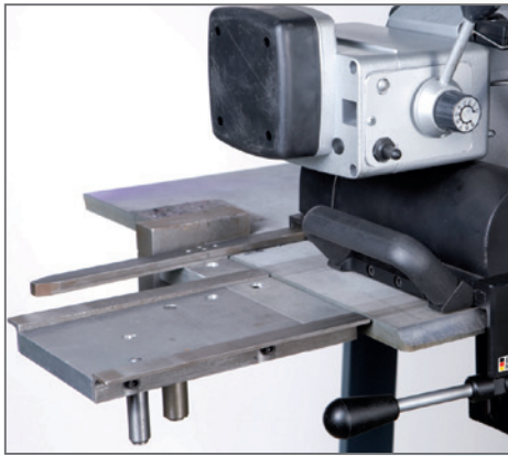
Führungsschiene der AutoCUT 500