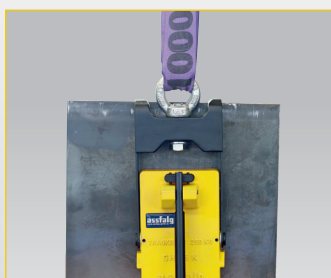
↑ Senkrechter Transport Fv = 1/3 Fh

Seit Jahrzehnten gelten die Krantransporter der SH-Serie als optimale Lösung für den Krantransport von Blechen, auch bei größeren Formaten. Im Gegensatz zu normalen Lasthebemagneten besitzen Kranmagnettransporter ein flacheres Magnetfeld, das ihnen erlaubt, dünnere Werkstücke wie Bleche schon ab 3 mm Stärke aufzunehmen. Sie sind für den waagrechten und senkrechten Transport geeignet und äußerst wirtschaftlich. Bei Biegepressen sind sie zur Blechtafelführung eine interessante Alternative zu mechanischen Trageklappen.